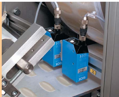
Coating-Verfahren zum Auftragen einer wirkstoffhaltigen Schicht