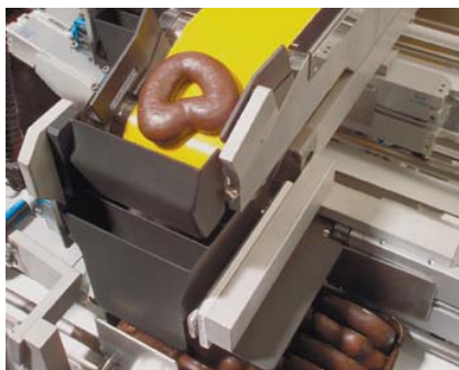
Sammeln der Lebkuchen und Beladen der Trays

Format Traypackung: L B H 230 145 40 mm andere Abmessungen auf Anfrage