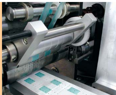
Schneiden der Folienbahn und Transport zur Stapelung