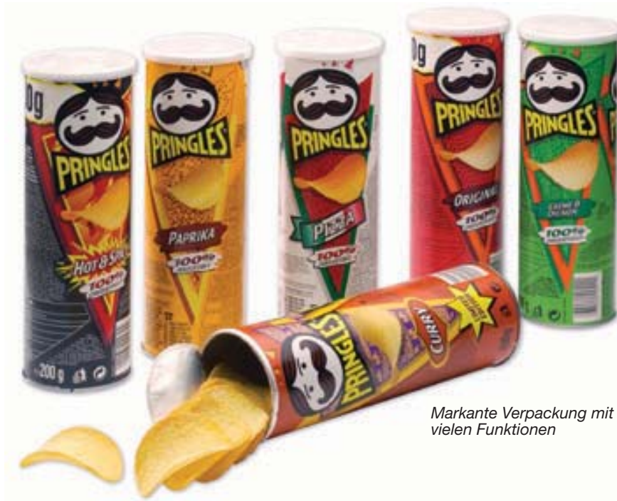
Markante Verpackung mit vielen Funktionen

Die gasdichte Verpackung für ein frisches Aroma.